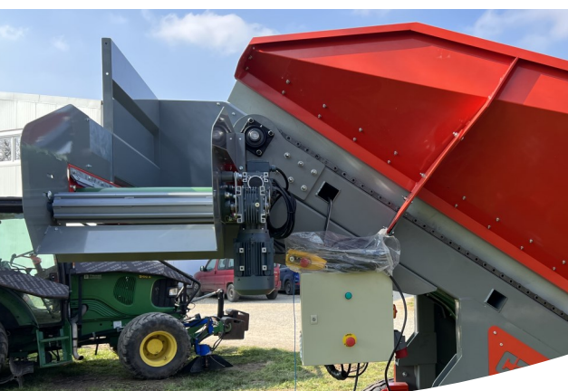
ÉBRANCHEUR ROULEAU ET COFFRET ÉLECTRIQUE