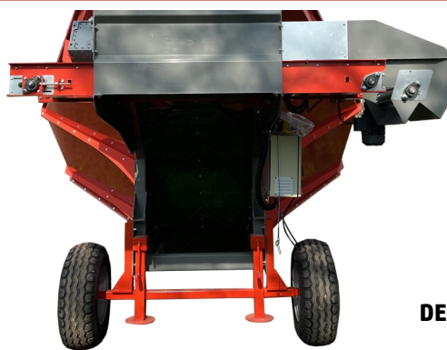
RUOTE E SUPPORTI REGOLABILI