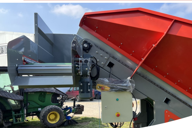
DELIMITAZIONE A RULLO E SCATOLA ELETTRICA